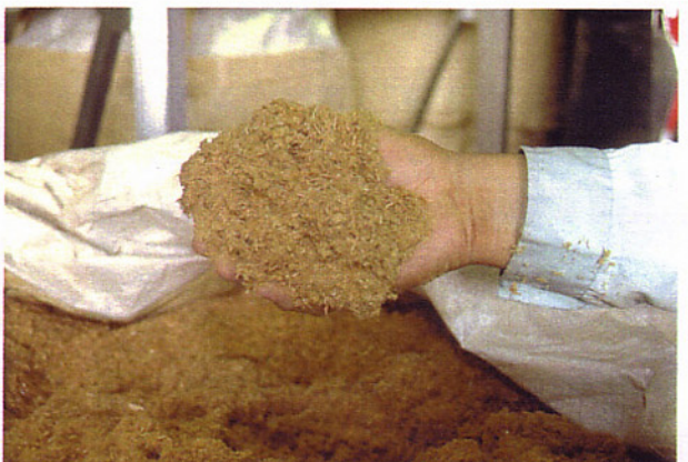
独自の手法により、パチスロ筐体の木質部を砕いた粉体。