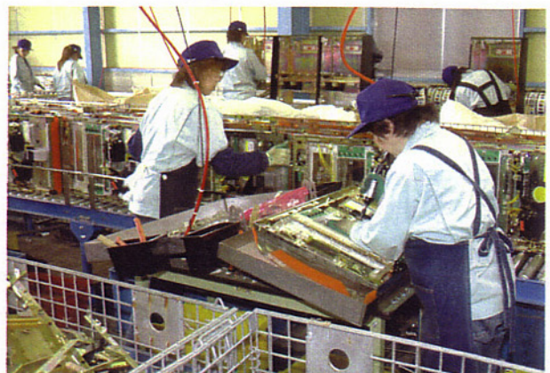
ばちんこ・パチスロ台とも、丁寧に手解体され、素材ごとに分別される。