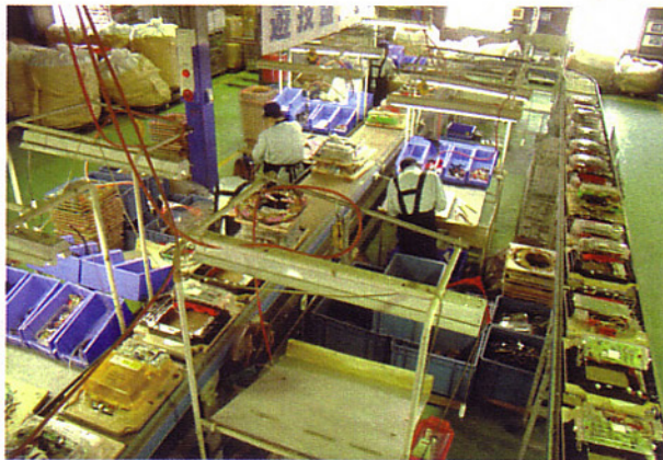
周回することにより高効率を実現している解体ライン。