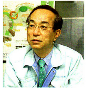
インタビューに答える高取代表取締役。

——パチスロの筐体は燃やすとガスが発生するのでサーマルにしく、ほとんどが埋め立てられていました。そこで当社では、筐体のリサイクルについて肥料製造会社と共同研究を行った結果、木材を粉体化することにより、堆肥として利用できることが分かりました。木材の粉体化には高度な技術を必要としますが、当社ではそれをクリアし、堆肥原料として専門工場へ出荷しています。そこででき上がった製品は緑化事業用、園芸用として利用されています。