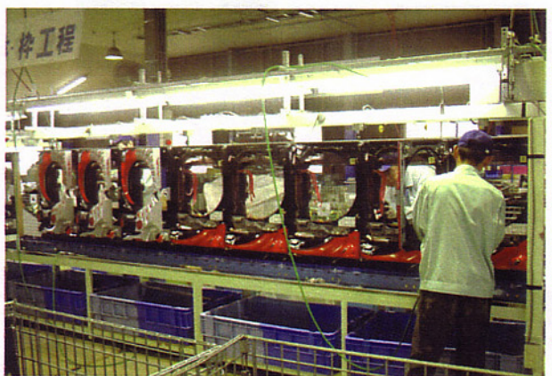
ばちんこ台は直立させた状態で表裏同時に解体される。