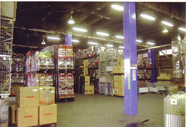
パチスロで7,000台、ばちんこで13,000台を収容できるストックヤード。